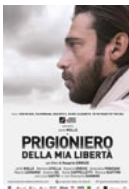
Prigioniero della mia libertà di Rosario Errico (85')

BORCHI Arpino, Isola del Liri, Sora, Posta Fibreno, Picinisco (Frosinone)