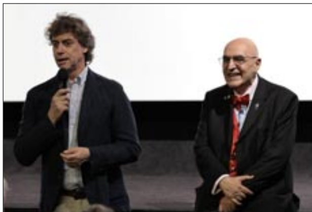
Alberto Angela inaugura la II edizione di Borghi sul Set. Accanto a lui Catello Masullo, direttore artistico del festival

Grande successo per la seconda edizione di Borghi sul Set Festival Cinematografico , organizzata dal Cinecircolo Romano, tanto che ne hanno dato notizia prestigiosi organi di stampa nazionali.