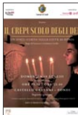
Il crepuscolo degli Dei dei Fratelli Latilla (15')